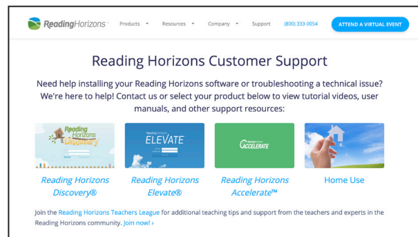
Asistencia técnica en el sitio web

Lo alentamos a que ayude a su estudiante con cualquier pregunta que tenga mientras navega o usa el software (hay videos de ayuda a los que se puede acceder haciendo clic en el signo de interrogación en la parte inferior del software y ayuda técnica en www.ReadingHorizons.com/support ). Sin embargo, le pedimos que no lea preguntas o pasajes ni le diga a su estudiante la respuesta a los elementos de las evaluaciones y lecciones. Simplemente dígame que adivine si tiene dificultad o no sabe la respuesta. Las evaluaciones y lecciones miden las habilidades actuales del estudiante y responden en consecuencia. Sabemos que le gusta ayudar, pero asegúrese de que el software averigüe lo que su estudiante sabe, ¡no lo que usted sabe!